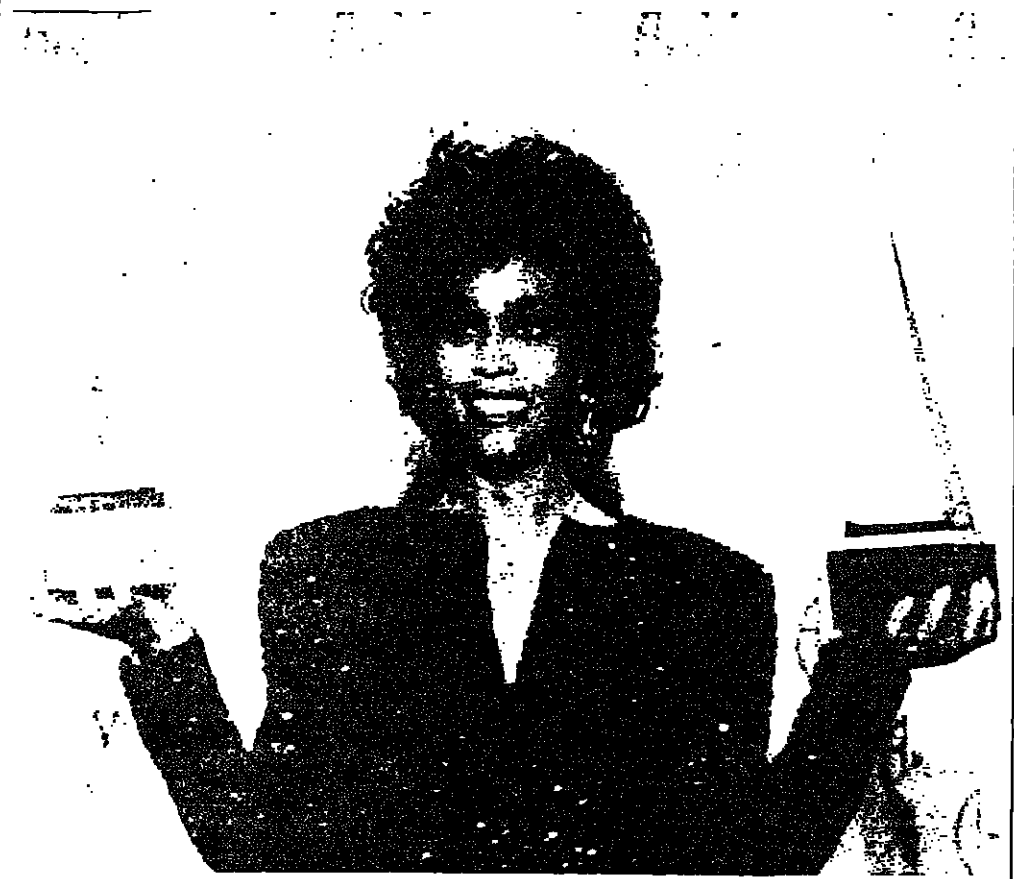
في حفلة توزيع جوائز الوسقى الأميركية التي جرت جوائزها ١١ جائزة. لوس انجلس - ١ ف ب